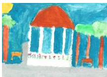
Safaa Errayass (Briefmarke und Postkarte / Musikpavillon im Stadtpark)