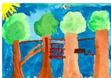
Leira Sophie Schult-Avilés (Postkarte / Kletterpark)

Grundschule Innenstadt, Klasse 3c, 0178-3318757